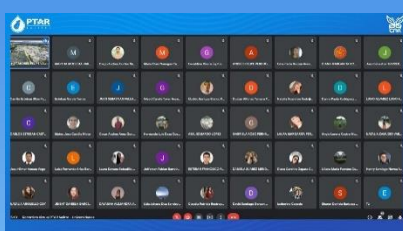
▲ Universidad Cooperativa