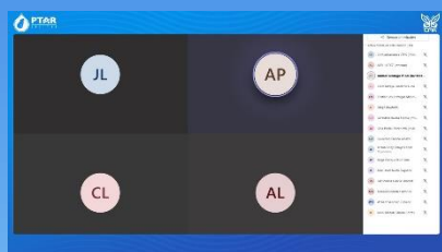
▲ Ministerio de Hacienda

Los recorridos virtuales hacen parte del programa de capacitación y educación ambiental, componente incluido en el plan de gestión social. A la fecha se han realizado 34 recorridos virtuales con la participación de 1.901 asistentes, beneficiando a instituciones educativas tanto universitarias como de educación media, instituciones públicas y privadas, al igual que empresas. De esta manera, se socializa el objetivo y aporte que hace la PTAR Salitre a la recuperación del Río Bogotá.