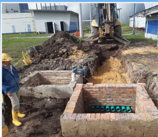
◀ Cajas de baja tensión y comunicaciones

Se continua con la instalación de las redes secas subterráneas en el área de fase I, con el fin de realizar la integración entre las dos fases de la PTAR Salitre.