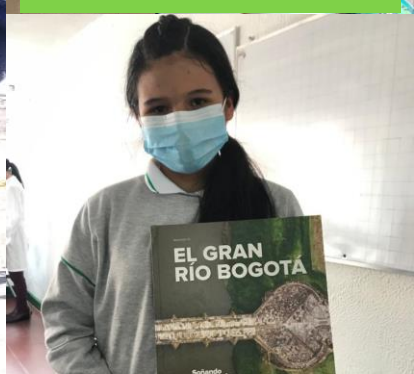
▲ Estudiante – Colegio Lorencita Villegas