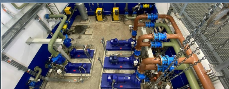
▲ Edificio de bombeo de lodos y flotantes operando con normalidad durante el mes de julio