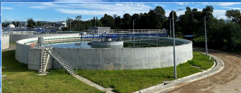
▲ Clarificador primario N° 1 y 2 en funcionamiento

Estructuras encargadas de la extracción de minerales y sólidos sedimentables no eliminados en procesos anteriores.