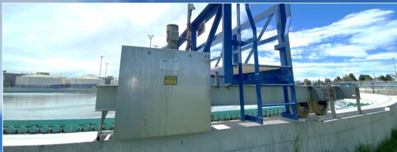
▲ Puente barredor de la clarificación secundaria

Área de extracción de minerales y sólidos sedimentables no eliminados en procesos anteriores. Durante el mes estuvieron en funcionamiento los clarificadores N° 1 - 6.