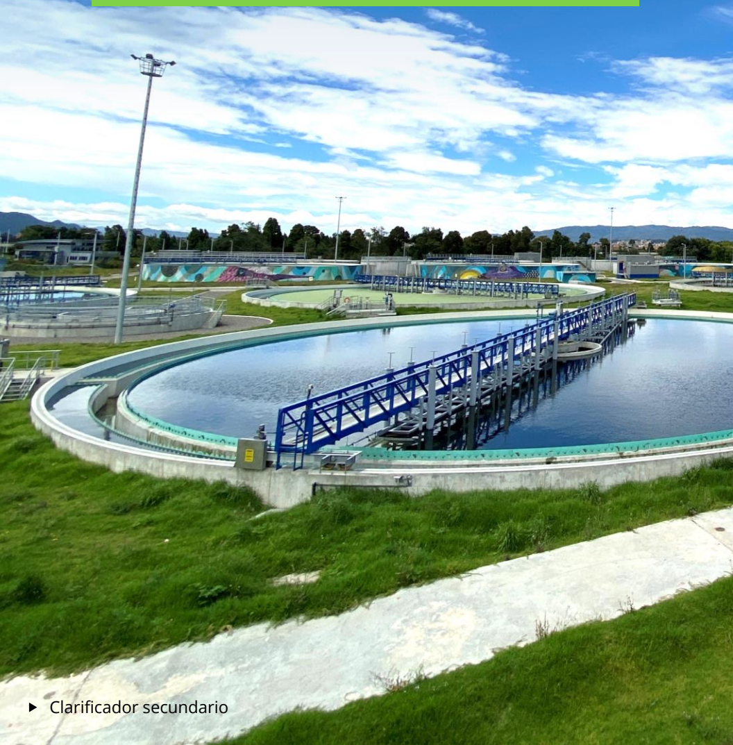
► Clarificador secundario