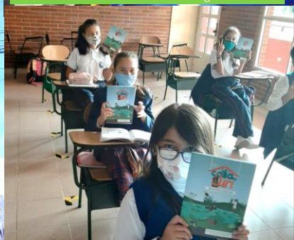
▲ Estudiantes - Colegio Eucarístico Mercedario de Suba