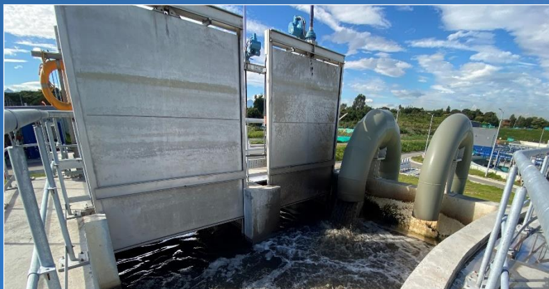
▲ Compuertas arqueta de regulación y medida de caudal en pleno funcionamiento

Distribución de caudales a la clarificación primaria, baypass y recolección de las aguas servidas de la planta.